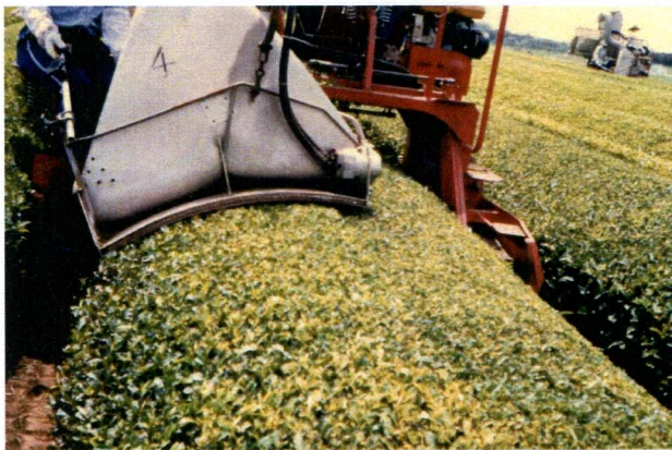
機械化された刈り取りによって、茶葉は静電気や摩擦熱の影響を受けます。