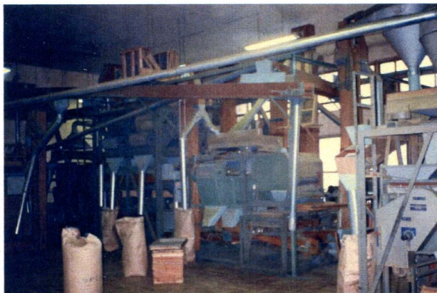
乾燥・焙煎・コンベアーラインで茶葉は静電気や摩擦熱の影響を受けます。