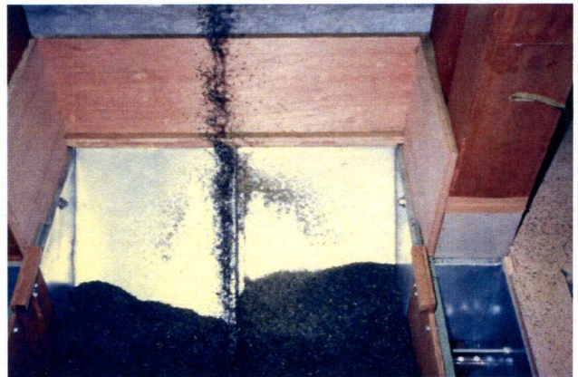
出来上がったお茶製品