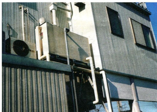
MDAマイナスイオン水自動製造受水槽