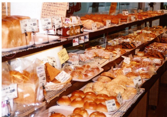
(株)ジャストバイク アミーさんの店内