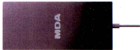
活性シート HI GENKI MX-19