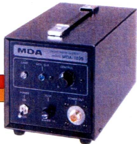
MDA電子発生機 MDA-1039・・・お一人用