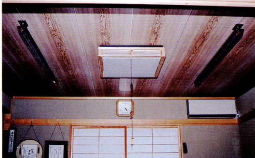
空気浄化器具 MX-9 (P)