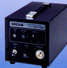
MDA 電子発生機 MDA-1039 (B)