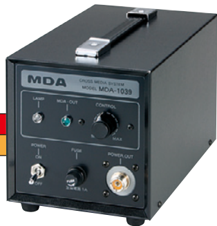
MDA 電子発生機 MDA-1039(B)