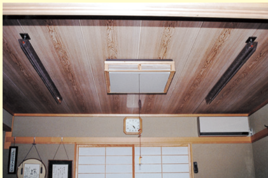
6畳間の天井に電子シャワー-MX-9 (P) 型 2本を設置した状況